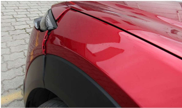
Sérült vészháritó elmozdult