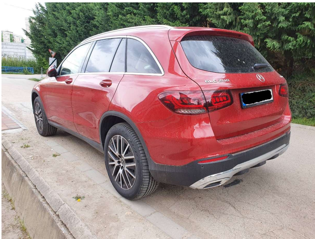
Jobb hátsó átló